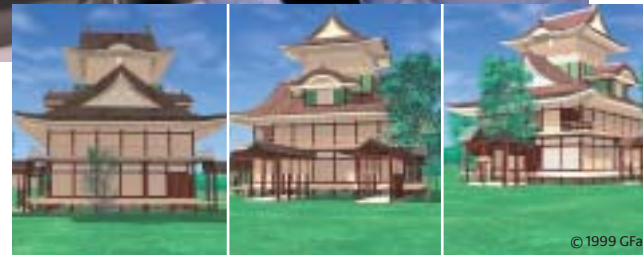
Oben: Mixed-Reality-System Unten: Virtuelle Rekonstruktion des japanischen Nobunaga Tempels