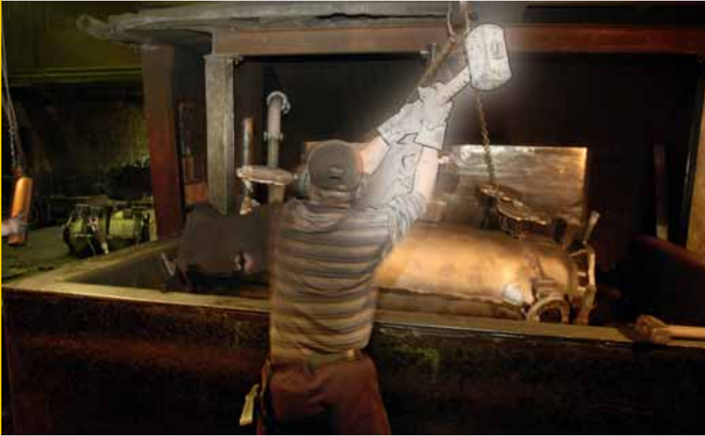
Bild Seite 28: Ein Arbeiter der Georg Fischer GmbH bereitet in der Gießerei Leipzig-Großschochen an der sogenannten Kerneinlegestrecke Formkästen vor. Dabei werden Modelle des späteren Werkstücks in Ober- und Unterkästen mit Formsand eingelegt. Der Sand wird verdichtet, die Form entfernt und die Kästen werden zusammengesetzt – die „verlorene Form“ ist zum Gießen bereit.