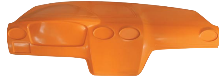
Slush-Haut für Instrumententafel