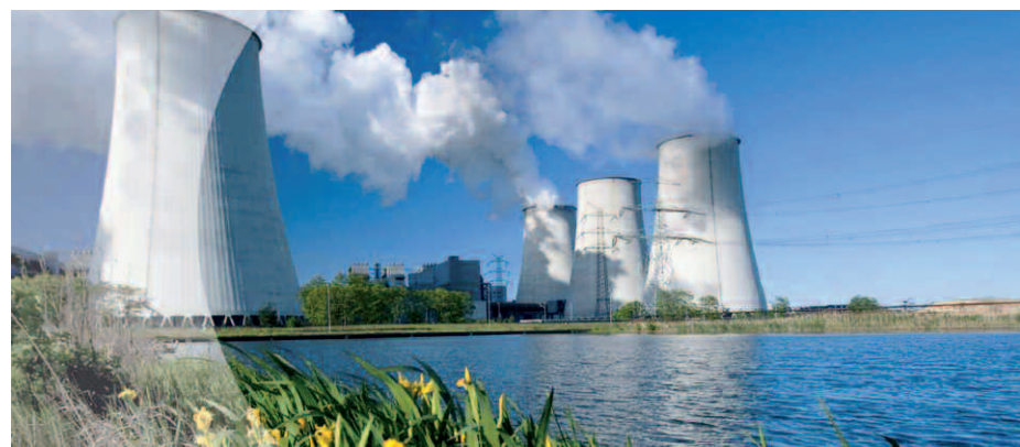
Das Braunkohlekraftwerk Jänschwalde bei Cottbus; in den Kühlwasserteichen werden Fische gezüchtet.