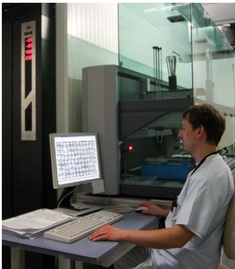
In der weltweit einzigartigen Jenaer Biobank können mehr als 500.000 Plasma-, Serum- und DNA-Proben von Sepsis-Patienten und Menschen mit schweren systemischen Infektionen bei -80^{\circ} Celsius gelagert werden.