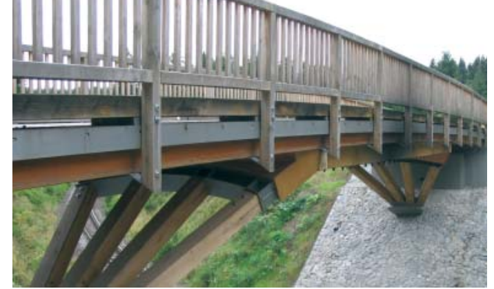
Natur, Ästhetik und Hochtechnologie im Einklang: eine von LKWs befahrbare Holzbrücke im Harz.