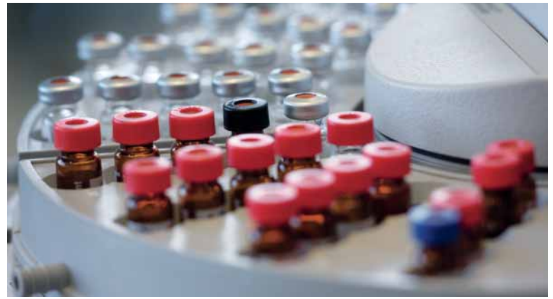
Bild links: Die Spitzen einer Mehrkanal-Pipette, wie sie bei Hochdurchsatz-Screenings (HTS) von Pipettier-Robotern verwendet wird.

Rechts: Beim HTS werden oft mehrere tausend verschiedene Substanzen in einer Versuchsreihe untersucht, um Moleküle zu finden, die beispielsweise bei der Entwicklung von Medikamenten hilfreich sein können.