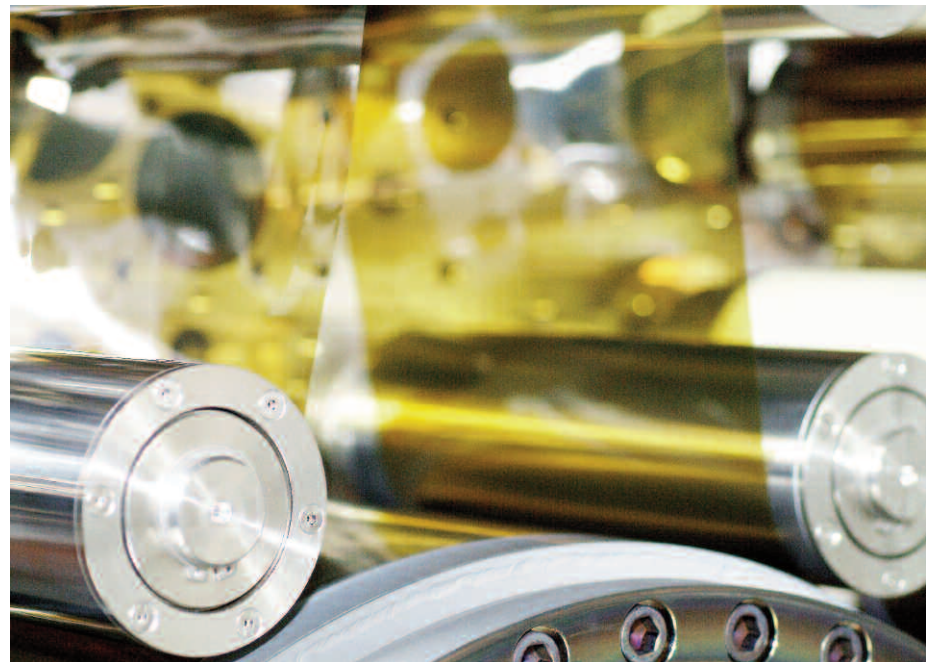
Bild oben: Eine Dünnschicht-Solarzelle aus einer Kupfer-Indium-Gallium-Diselenid-Legierung (CIGS-Zelle).