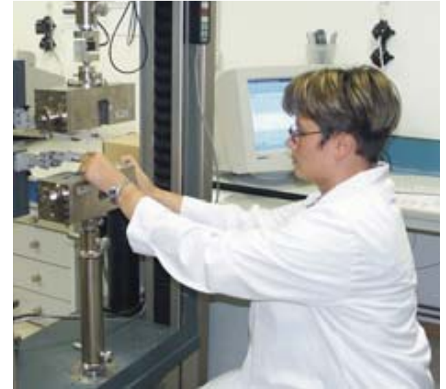
Die Qualität der Rohstoffe entscheidet maßgeblich über die Produktqualität

Das Innovationsforum stellt das Zusammenwirken der Partner entlang der Wertschöpfungskette in den Vordergrund