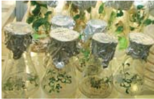
Bei IPK aus Pflanzenzellen gezüchtete Maiskeimlinge.

Für Winfriede Weschke, Leiterin des InnoPlanta-Projekts „Winterweizen“, sind große Mengen dagegen das Problem: Bei vielen Pflanzenzüchtungen wurde die Ertragssteigerung vor allem durch eine Erhöhung des Stärkegehalts erreicht. „Damit sinkt gleichzeitig der Eiweißanteil, der in Nahrungsmitteln jedoch wichtig ist“, so Weschke. Die promovierte Biologin hat nun bestimmte