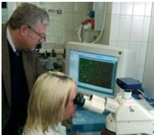
Per Fluoreszenz-Mikroskopie wird im Institut für Nichtklassische Chemie in Leipzig die Aktivität von Sporen beobachtet.