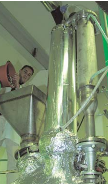
Im so genannten Badge-Reaktor können bis zu 400 kg flüssiges Recyclat gewonnen werden.