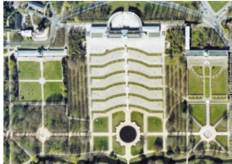
Schloss Sanssouci, Potsdam

Die Hauptstadtregion Berlin-Brandenburg ist auf dem besten Weg, sich als ein führendes Zentrum der Geoinformationswirtschaft in Deutschland zu etablieren.